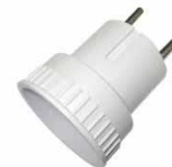
Адаптер переходный белый 6А 250В б/з E 210