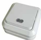
Серия Олимп Выключатель одноклавишный с подсветкой