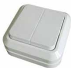
Серия Олимп Выключатель двухклавишный