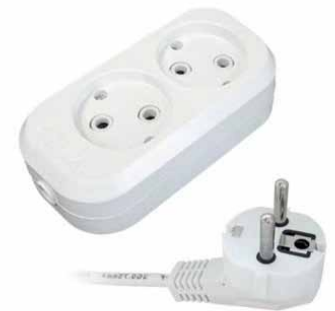
ПВС E-202, E-203, E-204