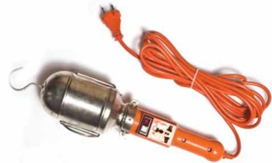
Светильник переносной с удлинителем-шнуром + приборная розетка, плоская вилка