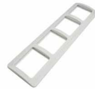
Серия Валери Рамка четырехместная горизонтальная