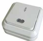
Серия Олимп Выключатель одноклавишный проходной с подсветкой