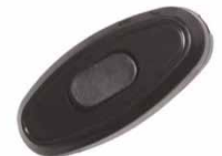
Переключатель черный 6А 250В E 212