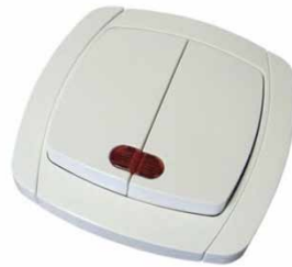
«СЕВИЛЬ» более дешевая