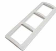
Серия Валери Рамка трехместная горизонтальная