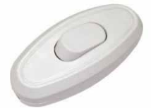
Переключатель белый 6А 250В E 211