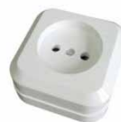
Серия Олимп Розетка одноместная 6/3