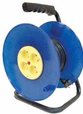
ВЕМ-250 240 мм (ПВС)