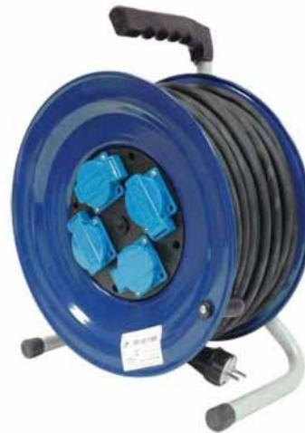
ВЕМ-259 IP-44 320 мм (КГ)