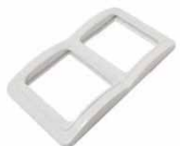
Серия Валери Рамка двухместная вертикальная