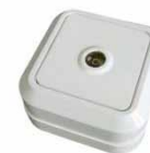
Серия Олимп Розетка телевизионная