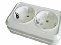
Серия Олимп Розетка двухместная 0/3