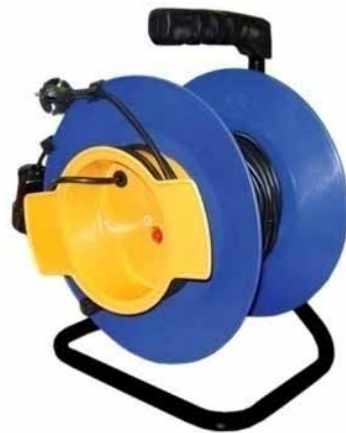
У10-027 и У10-027 (ПВС)