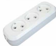
Колодка 3-ш. АБС-пластик б/з E 203