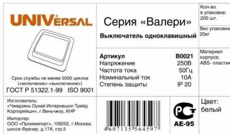
Этикетка для групповой упаковки