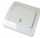
Серия Валери Выключатель однопольный проходной