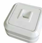
Серия Олимп Розетка телефонная