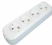
Колодка 4-ш. АБС-пластик б/з E 204