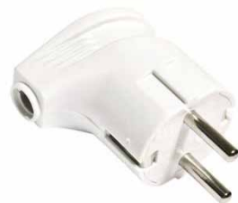
Вилка угловая белая 16A 250В с/з