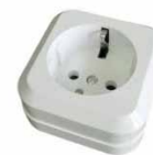
Серия Олимп Розетка одноместная 0/3