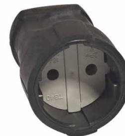
Штепсельное гнездо черное ПВХ-облиц 6/з