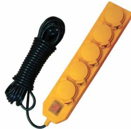
У10-026 IP-44 (ПВС / КГ)