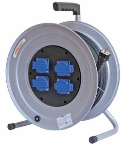
Y16-046 IP-44 365 мм (КГ)