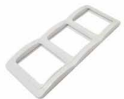
Серия Валери Рамка трехместная вертикальная