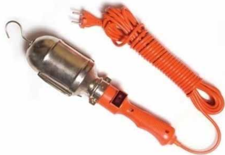
Светильник переносной с удлинителем-шнуром, плоская вилка