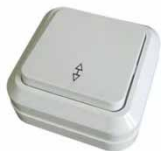
Серия Олимп Выключатель одноклавишный проходной