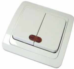
«ВАЛЕРИ» более дешевая есть рамки