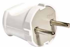
Вилка белая 6A 250В 6/з