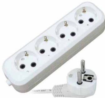
ПВС У10-553, У10-554, У10-555