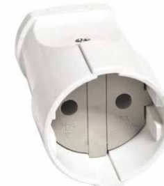
Штепсельное гнездо белое 10A 250В 6/з