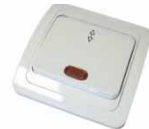
Серия Валери Выключатель однопольный проходной с подсветкой