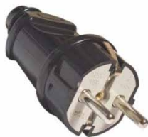
Вилка прямая черная 16A 250В с/з