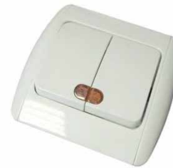
«ЛИЛИЯ» более дорогая защитные шторки