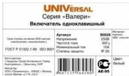
Этикетка для индивидуальной упаковки