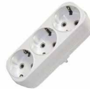
Разветвитель 3-ш. плоский 6А с/з E 205