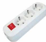
Колодка 4-ш. АБС-пластик с/з S 303