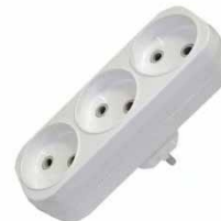
Разветвитель 3-ш. плоский 6А б/з E 206