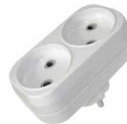
Разветвитель 2-ш. плоский 6А б/з E 208