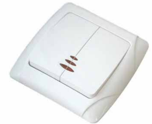
«МАРГАРИТА» более дорогая есть рамки