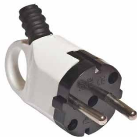
Вилка угловая с ушком белая 16A 250В с/з