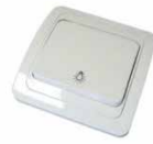
Серия Валери Выключатель однопольный выключатель