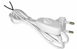
Шнур с вилкой с проходным выключателем E 213