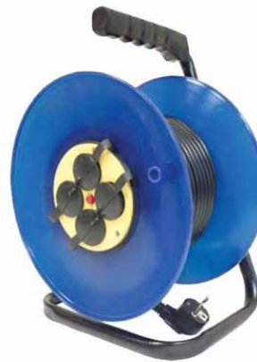
ВЕМ-250 IP-44 270 мм (ПВС)