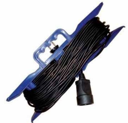
Шнуры на рамке УШ-6, УШ-10, УШ-16 (ПВС)