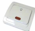
Серия Валери Выключатель однопольный выключатель с подсветкой