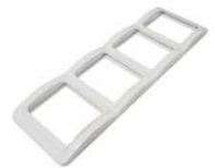
Серия Валери Рамка четырехместная вертикальная