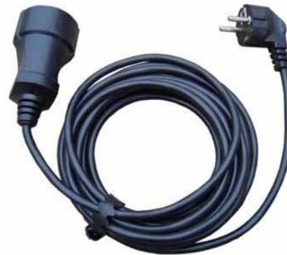
Шнуры УШ-6, УШ-10, УШ-16 (ПВС)