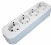
Колодка 4-ш. АБС-пластик с/з E 304