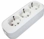
Колодка 3-ш. АБС-пластик с/з E 303