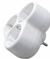
Тройник круглый белый 16А 250В 3-ш. с/з E 209