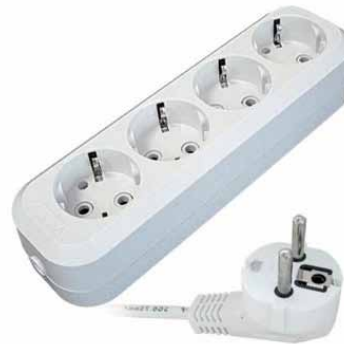
ПВС E-302, E-303, E-304