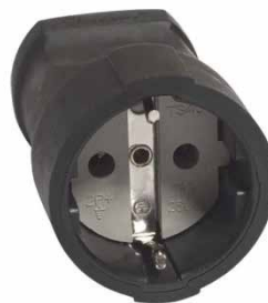
Штепсельное гнездо черное 16A 250В с/з