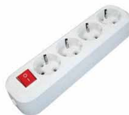
Колодка 4-ш. АБС-пластик с/з S 304