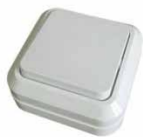
Серия Олимп Выключатель одноклавишный