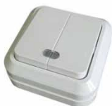
Серия Олимп Выключатель двухклавишный с подсветкой