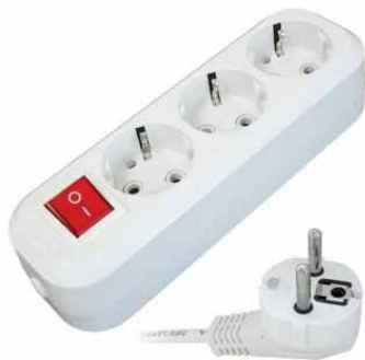
ПВС S-303, S-304