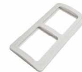
Серия Валери Рамка двухместная горизонтальная