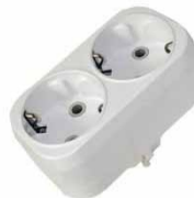
Разветвитель 2-ш. плоский 6А с/з E 207