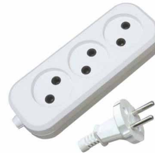
ПВС У6-011М, У6-639М, У6-766М