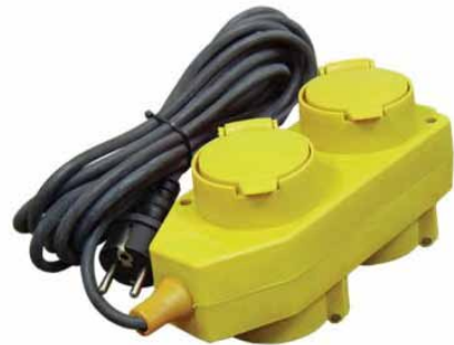
У16-040 IP-44 (ПВС / КГ)