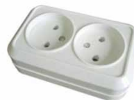
Серия Олимп Розетка двухместная 6/3