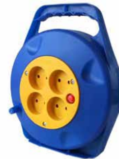
Y10-015 и Y6-015 (ПВС)