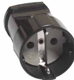
Штепсельное гнездо черное 16A 250В с/з